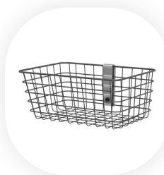
Petit panier en fer gris foncé 98-136-282