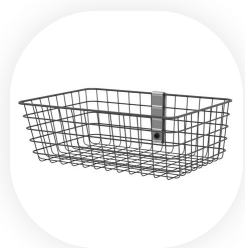
Grand panier en fer gris foncé 98-135-282