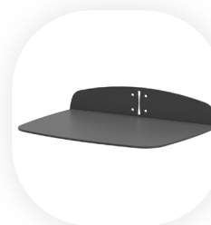
Etagère utilitaire gris foncé 97-507-282