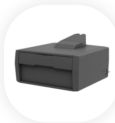
Grand tiroir simple gris foncé 97-989-622