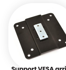
Support VESA arrière