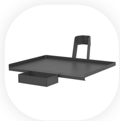
Plateau avant gris foncé 98-417-282