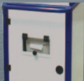
Ausgang Modell TAV L12