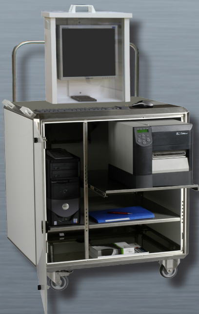
MOBINOX mit Option LCD SCHUTZGRAD IP 65 und Option TAV L 24