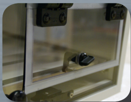
Ausgang Modell TAVL 12