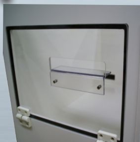
Salida Luz + Guía