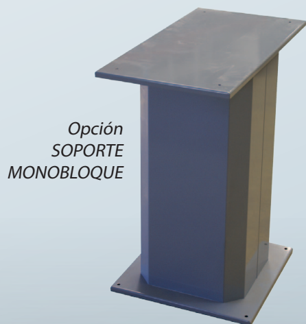
Opción SOPORTE MONOBLOQUE

La solución de protección y insonorización para las impresoras térmicas de gran tamaños