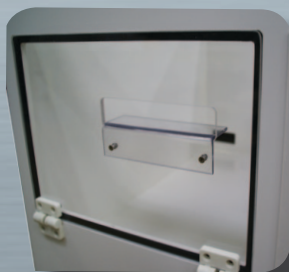
Salida Luz +Guía

Opciones SORTIE ETIQUETTES Salida de etiquetas