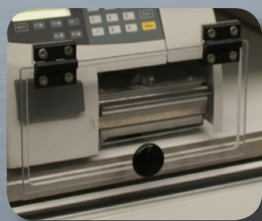
Salida modelo TAV