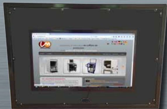
PI TV con la vidria anti-reflejo