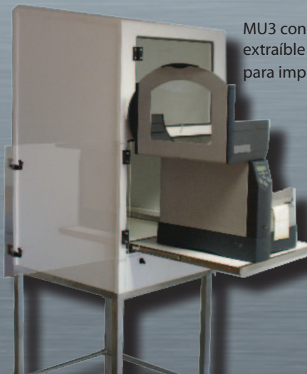
MU3 con bandeja extraíble para impresora