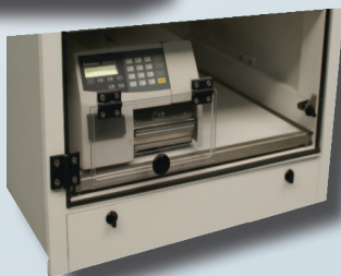
Salida modelo TAV L12