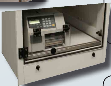
Sortie modèle TAV L12