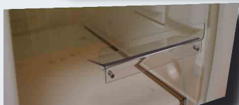
Sortie LUMIERE + GUIDE