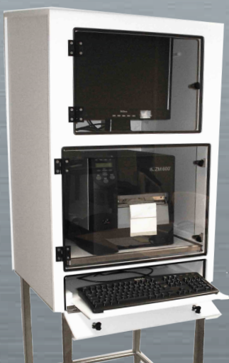
MU 3 complet avec tablette clavier ouverte