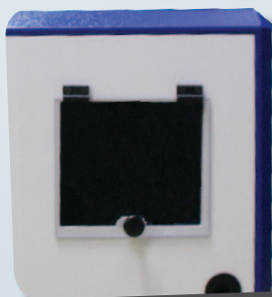
Salida TAV L 24

La solución de protección móvil para sus equipos informáticos completos