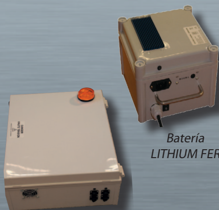
Batería LITHIUM FER