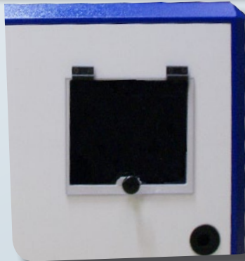
Ausgang TAV L 24

Die mobile Schutzlösung für Ihre komplette Datenverarbeitungsanlage