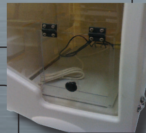
Uscita opzione TAV L 24