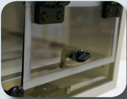
Salida L 12

La solución de protección móvil en Acero Inoxidable para sus equipos informáticos