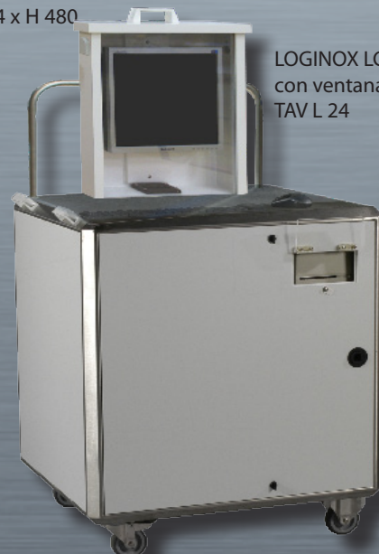
LOGINOX LCD con ventana TAV L 24