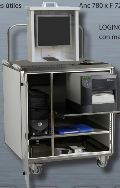
LOGINOX LCD con materiales informáticos