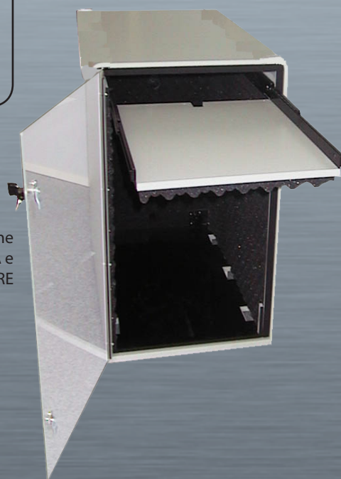
ISS 1 con l'opzione RIPIANO TASTIERA e opzione SERRATURE