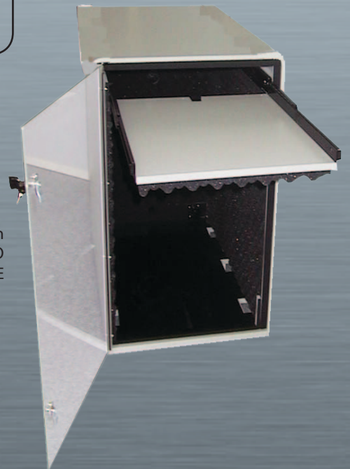
ISS1 : con Opción BANDEJA TECLADO y Opción CIERRE