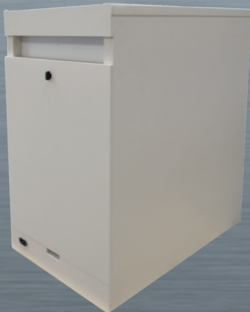
ISS 1 : Vista de la parte trasera