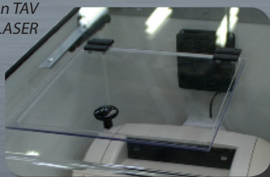
Opción TAV LASER