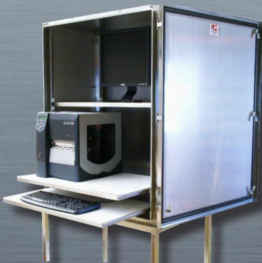
GM INOX ouvert