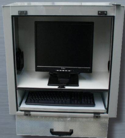
CPI con ripiano tastiera e mouse aperto