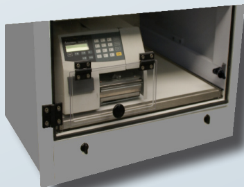
Salida TAV L12