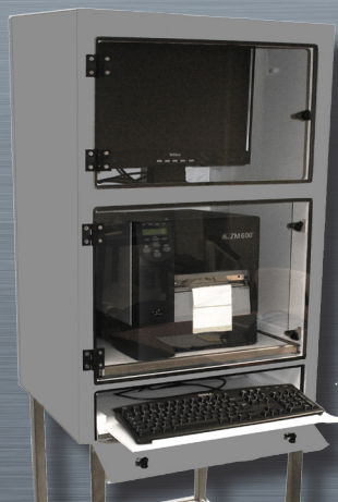
CPI 3 con bandeja teclado extraída