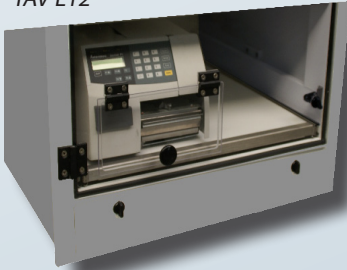
Ausgang Modell TAV L12