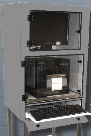
CPI 3 avec tablette clavier extraite