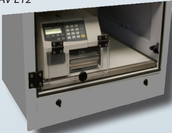
Sortie modèle TAV L12