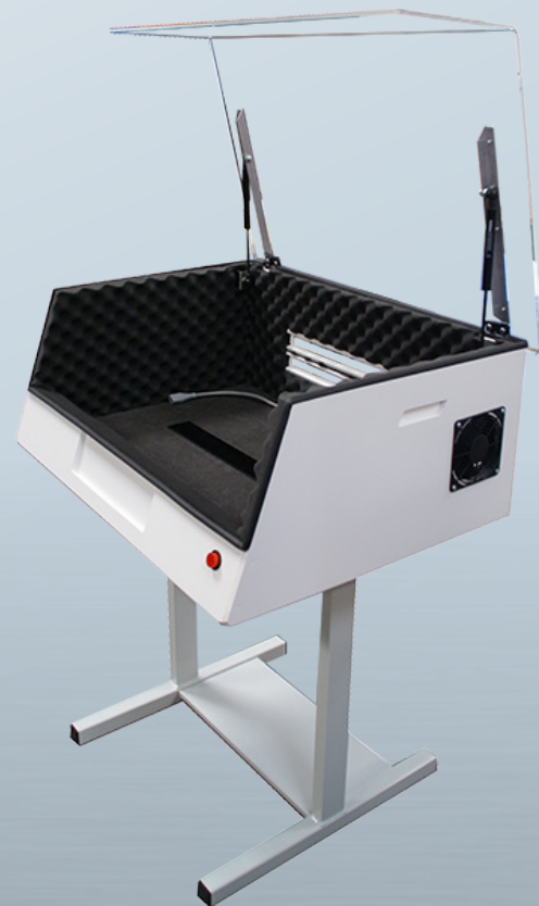
COFANO D'INSONORIZZAZIONE con opzione BASE SC1

> Vi preghiamo di contattarci per verificare la corrispondenza della stampante con il cofano di insonorizzazione