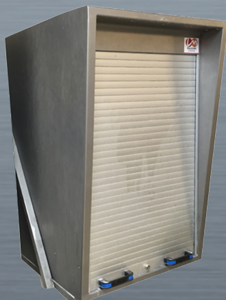
AGRO PM rideau alu fermé +et option fixation murale