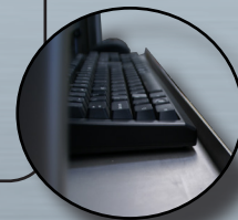
Butée pour la dernière tablette

DIMENSIONS DE L'AGRO PM rideau alu en mm :