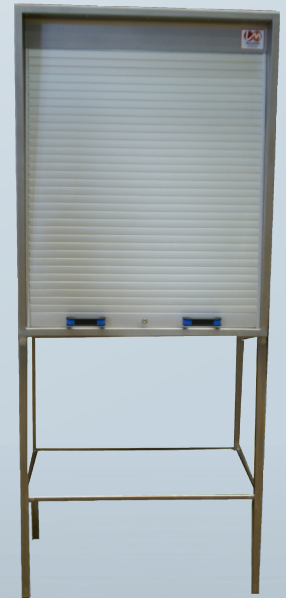
2 poignées facilitant l'ouverture