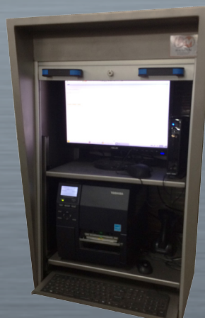
2 tablettes extractibles