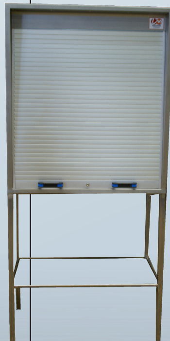
2 maniglie facilitando l'apertura

Esiste il Piccolo modello : AGRO PM Inox