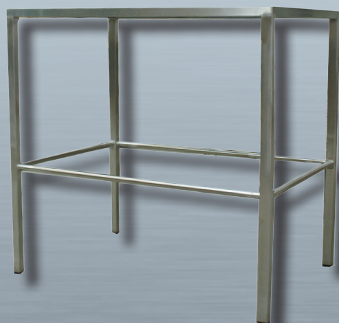
BASE DI APPOGIO