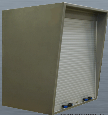
AGRO GM INOX chiuso