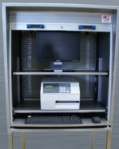
2 ripiani estraibili