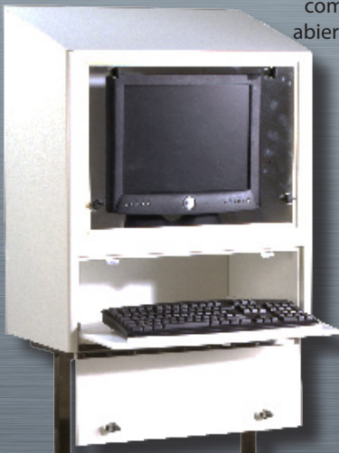
AGRO EC LCD con bandeja de teclado, bandeja de ratón y acceso lateral