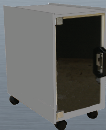
CPUC con opzione ROTELLE