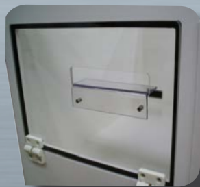
Sortie LUMIERE + GUIDE