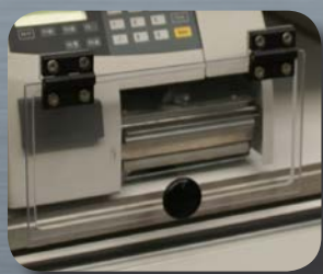
Sortie modèle TAV