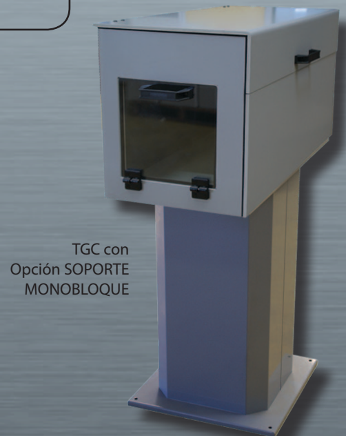
TGC con Opción SOPORTE MONOBLOQUE