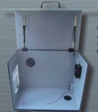
Vista interior del TGC : Apertura de ventilación sobre la parte lateral y ECA con interruptor sobre la parte trasera