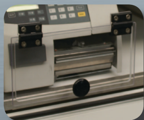
Salida modelo TAV